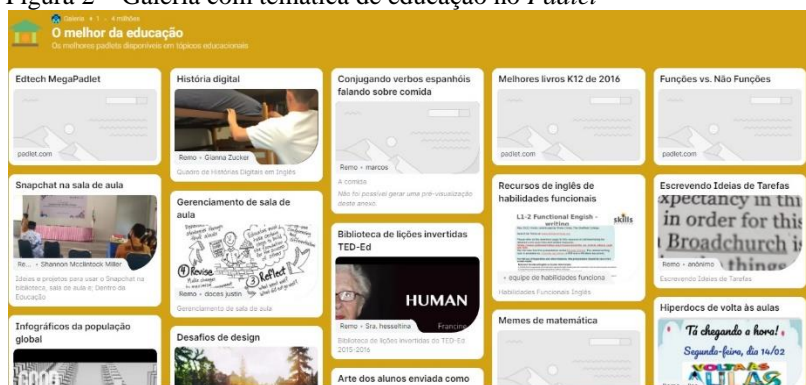
Figura 2 – Galeria com temática de educação no Padlet

Pode-se navegar no mural de forma anônima ou identificada com o suporte do reconhecimento da pessoa apoiado em e-mail. As possibilidades de interações são diversas, indo desde o modo privado, com restrições de acesso, até a forma pública, na qual é possível observar todas as interações no mural. Os caminhos diversos que o Padlet abre permitem ao usuário navegar em trilhas segmentadas por áreas de interesse. Na foto de reprodução de uma das galerias disponíveis, estão os murais relacionados a educação com links diversos passando pela leitura em e-books ilustrados para crianças entre cinco e sete anos de idade, ( https://padlet.com/kimbeeman/100PictureBooks ), até colaborações para escrita de argumento científico ( https://padlet.com/mklaus_quinlan/scienceargument ).