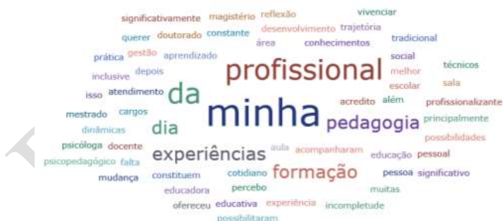
Imagem 1: Experiências ao longo da vida