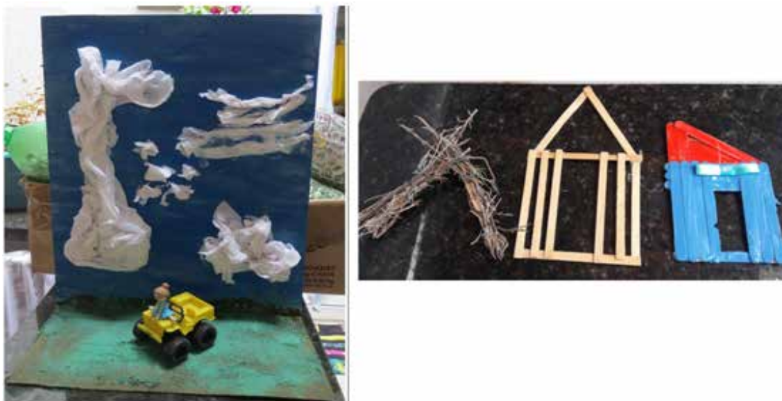
Figura 3 – Representação da história Nas nuvens e Os três porquinhos utilizada pela personagem vovó durante a contação