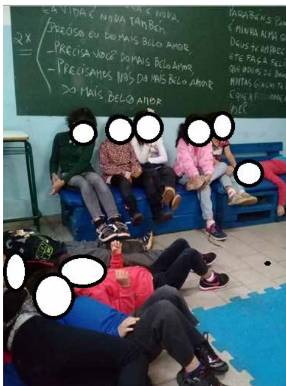
Figura 8 – Em destaque a contação de histórias na instituição não formal, 2018

No terceiro estabelecimento de ensino, uma instituição não formal, foi realizada a contação da história A menina do vestido azul conforme nas outras, com a contadora no papel de Vovó Fofuxa, utilizando a boneca e os demais objetos. Após a contação foi houve roda de conversa e as educadoras sociais participaram da discussão agregando itens que elas acharam interessantes (Figura 8).