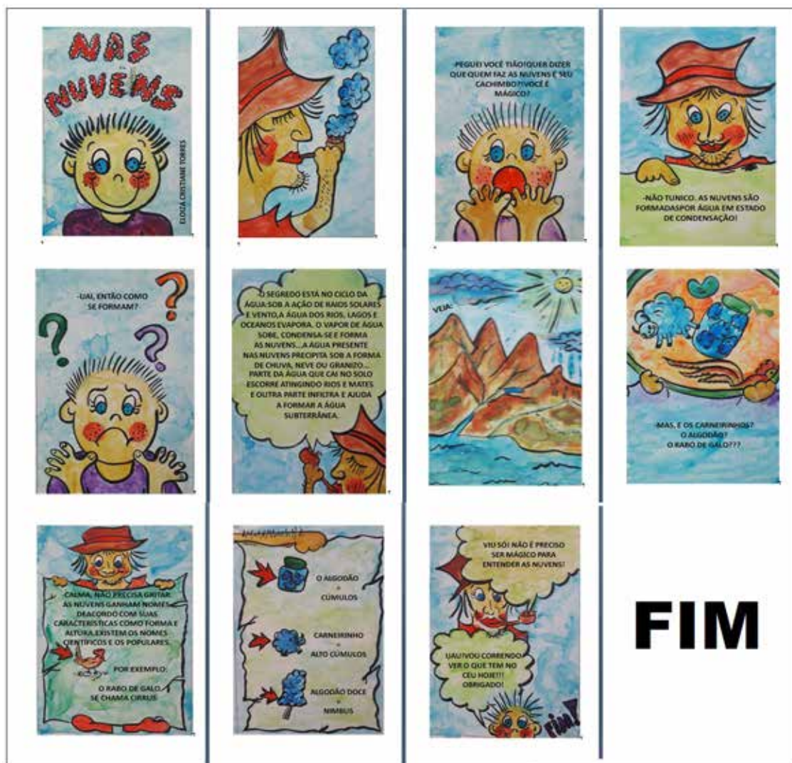
Figura 2 – Vista parcial do livro intitulado “Nas nuvens” escrito por Eloiza Cristiane Torres em 2018