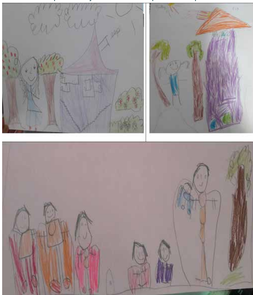
Figura 6 – Em destaque a coleção de desenhos produzidos pelos estudantes, 2018

Na Figura 6 observam-se alguns desenhos que chamaram a atenção pela riqueza de detalhes. Os desenhos evidenciam o envolvimento dos alunos com a história, com destaque para os elementos cênicos utilizados no momento da contação. Algumas crianças focaram na história em si, representando a menina, a casa; já outras evidenciaram o momento da contação de histórias em si, destacando a escola, a contadora, a boneca.