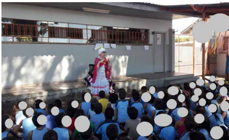
Figura 5 – Vista parcial da contação de histórias pela vovó em uma escola da rede municipal em Londrina/PR, 2018