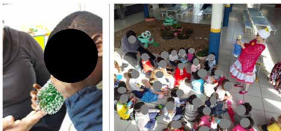
Figura 7 – Em destaque a criança cega interagindo com a árvore feita de material reciclável e a vista parcial da contação junto ao grupo de crianças de 3 a 6 anos

Essa preocupação em adaptar recursos didáticos materiais e imateriais (FISCARELLI, 2008) contribuiu para que o estudante cego se sentisse incluso na atividade e pudesse aprender de forma significativa, e, o mais importante, levou os demais (professores e crianças) a perceberem a importância de estarem juntos na escola e respeitarem as diferenças, conforme discutido por Cunha (2015).