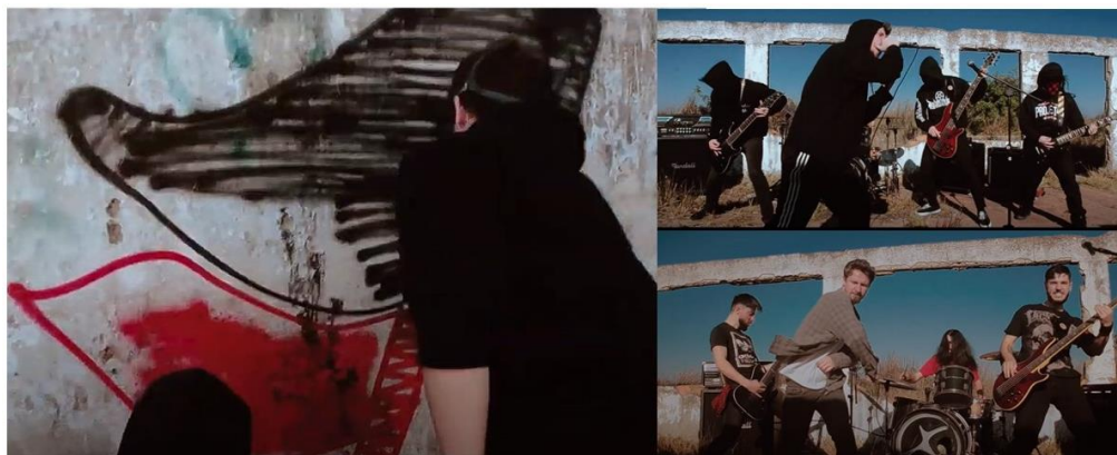
Figura 3. Três prints de cenas do videoclipe da música Farda demente – Banda Sarrafo.