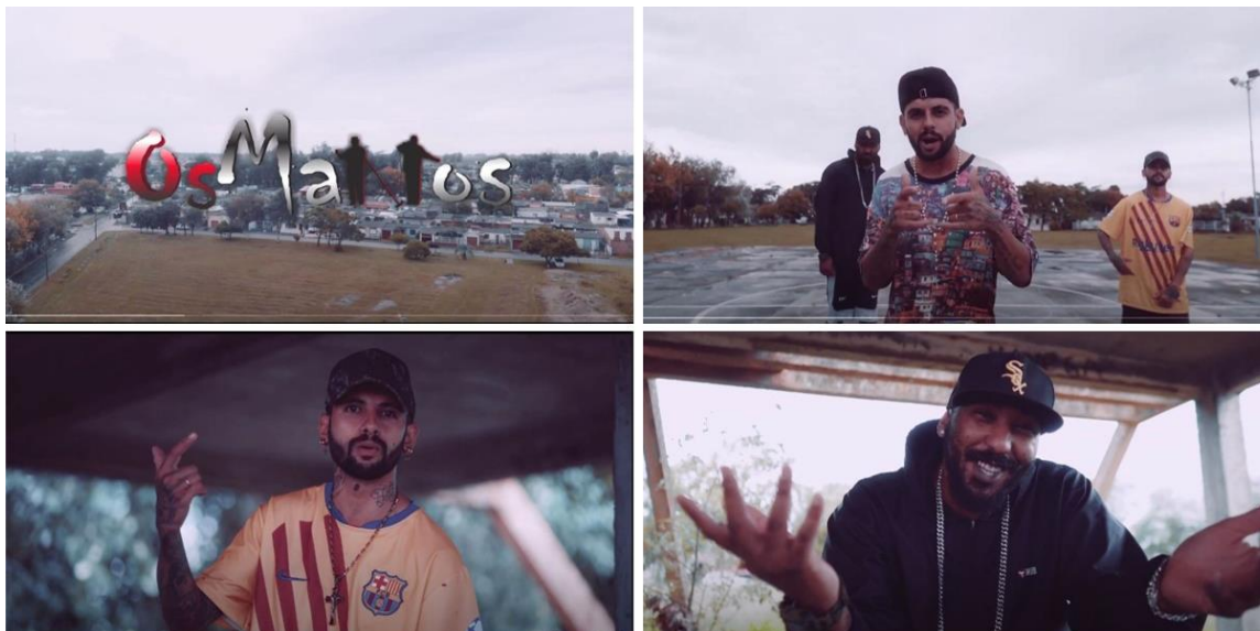
Figura 4. Prints das cenas do videoclipe Salve Quebrada part II – Gaúchos MC's feat Igão.