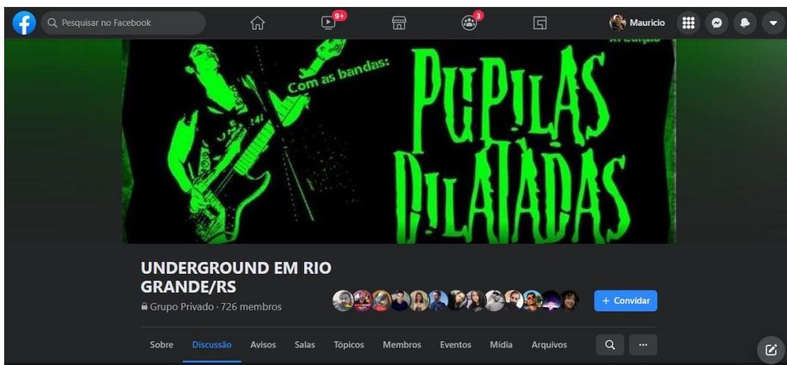
Figura 1. Print do grupo Underground em Rio Grande/RS.