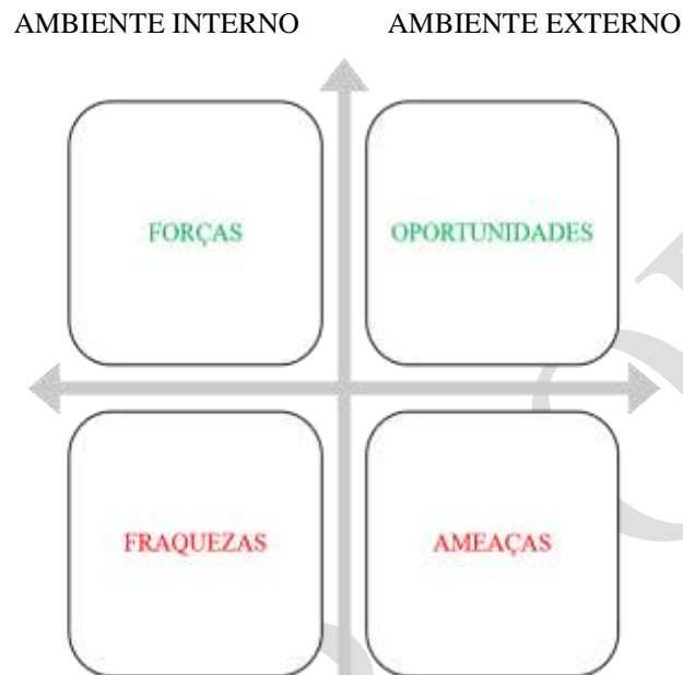
Figura 1. Representação gráfica da Matriz FOFA.