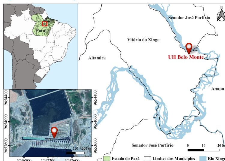
Figura 1 – Localização da Usina Hidrelétrica de Belo Monte

A usina hidrelétrica de Belo Monte localiza-se no Estado do Pará, na bacia hidrográfica do Rio Xingu, na Amazônia brasileira. O empreendimento compreende a região das cidades de Altamira, Vitória do Xingu, Senador José Porfírio e Anapu, na área conhecida como Volta Grande do Xingu (Figura 1).