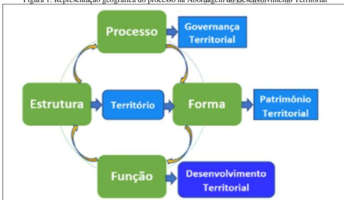
Figura 1: Representação geográfica do processo na Abordagem do Desenvolvimento Territorial

Essa interpretação visa propor uma nova perspectiva para o desenvolvimento territorial, valorizando o patrimônio local e promovendo uma governança mais inclusiva. O objetivo dessa interpretação é o de propor um referencial que permita explorar novas possibilidades na dinâmica de desenvolvimento local, com relevo na ativação do patrimônio territorial como estratégia central. Detalhamos as interações em quatro categorias: território, governança territorial, patrimônio territorial e desenvolvimento territorial. Aqui a ênfase recai sobre os processos inerentes ao desenvolvimento territorial (Dallabrida; Rotta; Büutenbender, 2021). A Figura 1 nos mostra a representação geográfica do processo na Abordagem do Desenvolvimento Territorial.