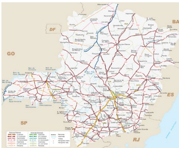
Figura 1 – Mapa de sistemas de transporte terrestre de Minas Gerais