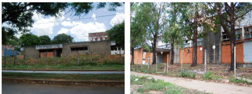
Figura 3 – Plantas fabris abandonadas no Cemitério de Indústrias