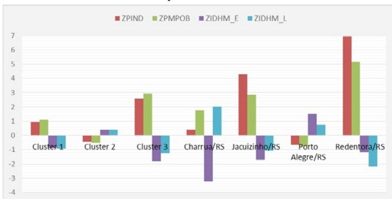
Figura 3 – Indicadores padronizados de extrema pobreza, pobreza, educação e saúde dos clusters e municípios outliers do Rio Grande do Sul: 2010

O mesmo ocorre em regiões extremamente pobres, onde se observam que os indicadores de educação e saúde são relativamente baixos. Nas regiões que apresentam alto IDH-E e IDH-L, os indicadores de pobreza são inferiores, o que confirma os postulados de teorias que se vinculam à economia da educação (Figura 3).