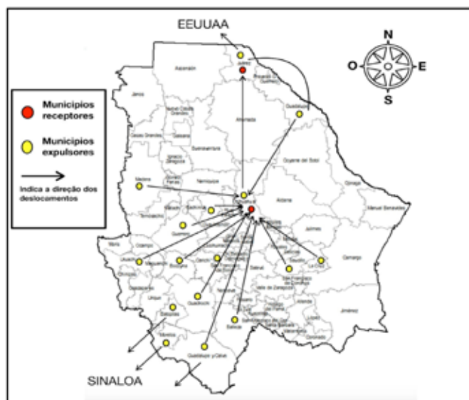
Mapa 3 – Presentación del desplazamiento: zonas expulsoras y receptoras en Chihuahua