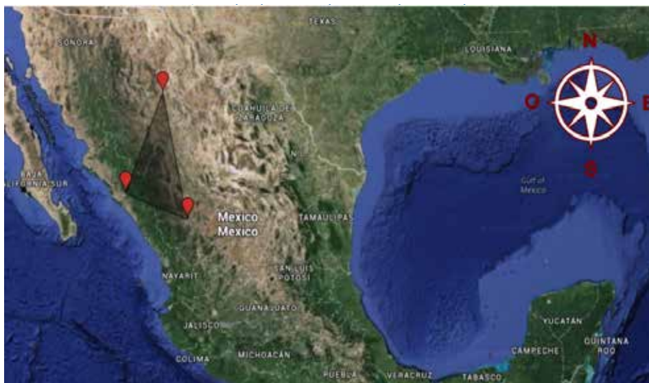
Mapa 2 – Presentación de una de las regiones de México en que se producen diversos