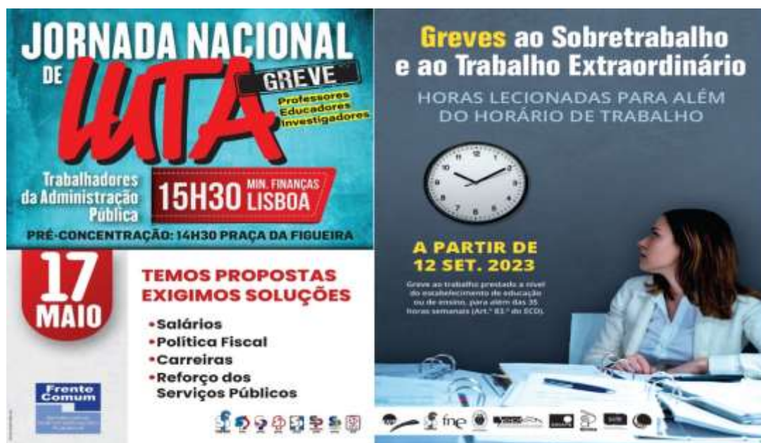
Posteres da FENPROF das pautas das greves.

apresentam as reivindicações dos professores.(2,3)