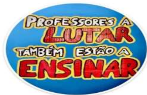
Imagem ilustrando o lema da greve dos professores.