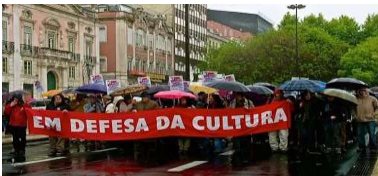
Manifestantes sobre o dia da Revolução dos cravos.

Fonte: https://commons.wikimedia.org/wiki/File:Defending_the_Culture_(7113768205).jpg(1)