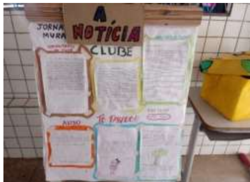
Figura 1- Jornal das crianças cineclubistas