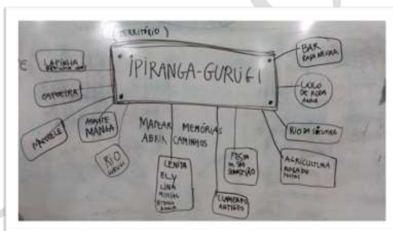
Figura 3: Quilombos Gurugi e Ipiranga