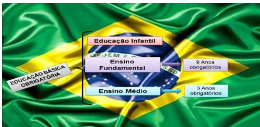
Figura 2 – Resumo da organização da Educação Básica Brasileira