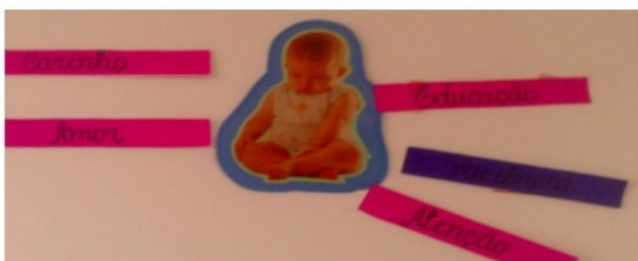
Figura 1 – Dinâmica “sentimento afetivo pelo bebê”

As gestantes demonstraram os sentimentos mais variados de carinho e amor pelos bebês que aguardavam. Notava-se isso na expressão, nos gestos, no tom da voz e não somente na fala ou na palavra que fora escolhida. No estudo de Piccinini et al. (2008), as mães referiram sentir a gravidez como uma conquista, e demonstraram sentimentos de conformidade, inadequação, estranhamento e intensificação nos sentimentos.