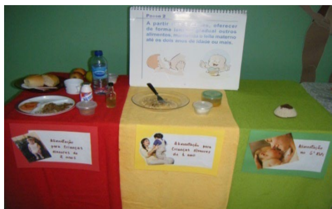
Figura 7 – Dinâmica “Sinal da boa alimentação”

O Aconselhamento Nutricional é essencial para a prevenção da obesidade infantil porque pode evitar possíveis consequências que essa doença pode acarretar na idade adulta. Para a prevenção da obesidade infantil é importante retardar alimentos farináceos, evitar alimentos muito doces, fortalecer a atividade física, controlar e vigiar constantemente o peso corporal, promover educação nutricional e hábitos de vida saudáveis, e enfatizar que a obesidade é uma enfermidade de difícil cura e que todos devem lutar por sua prevenção (COUTINHO, 1999).