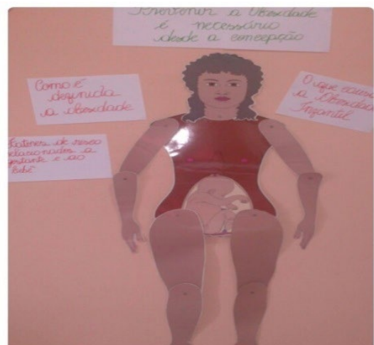
Figura 2 – Contação de histórias

A ferramenta utilizada foi contação de histórias (Figura 2), montagem de pirâmide alimentar da gestante e, em seguida, assistiram parte de um documentário (MUITO ALÉM DO PESO, 2012). Primeiramente foi exposta a figura de uma gestante. Ao observar a figura foi contada a história de uma gestante adolescente que esperava seu primeiro bebê. Nessa história foi enfocada a definição da obesidade infantil, as causas e complicações da doença e os fatores de risco relacionados à gestante e ao bebê, além da sua forma de prevenção.