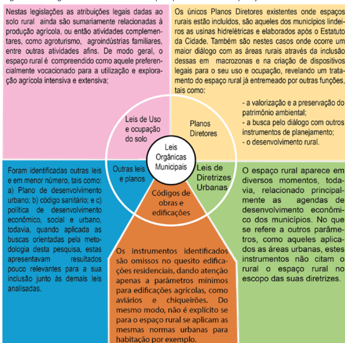
Figura 2 – Convergências acerca do rural entre os principais instrumentos de planejamento territorial analisados