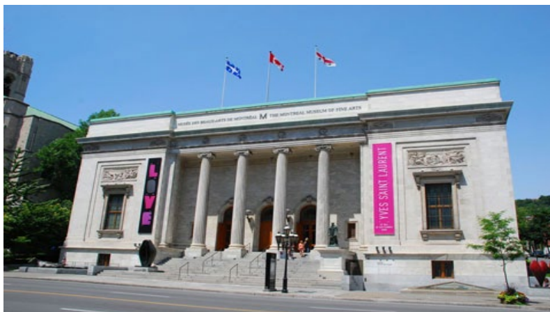
Figura 1 – Museu de Belas Artes