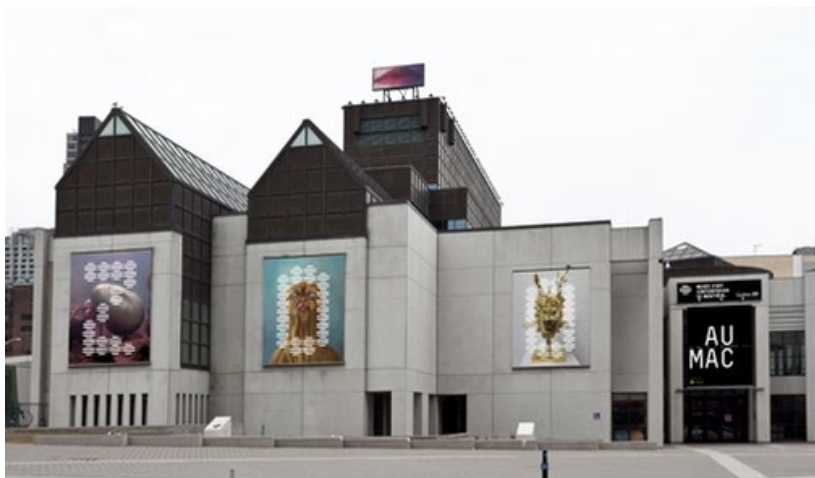
Figura 2 – Museu de Arte Moderna